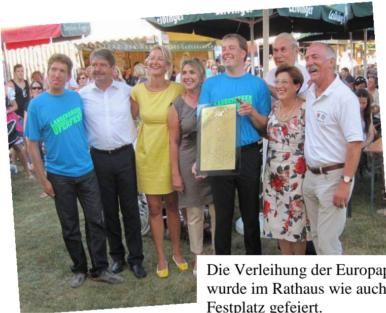
Die Verleihung der Europaplatette wurde im Rathaus wie auch auf dem Festplatz gefeiert.