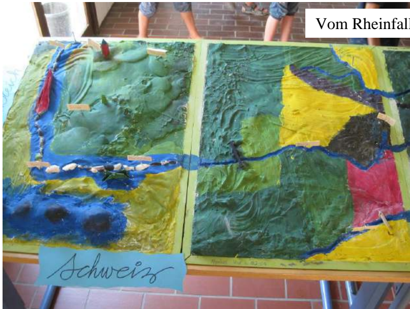
Vom Rheinfall bis nach